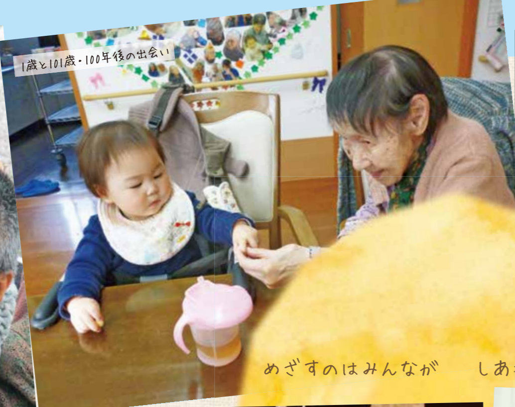
1歳と101歳・100年後の出会い