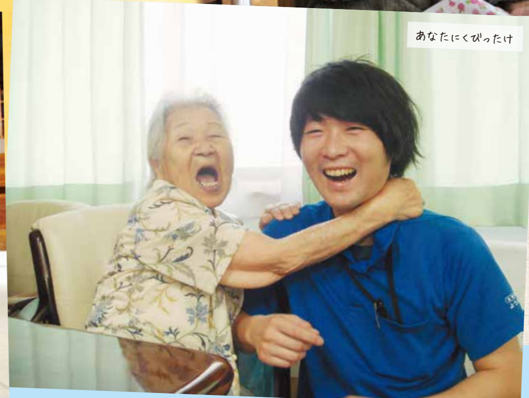
あなたにくびったけ