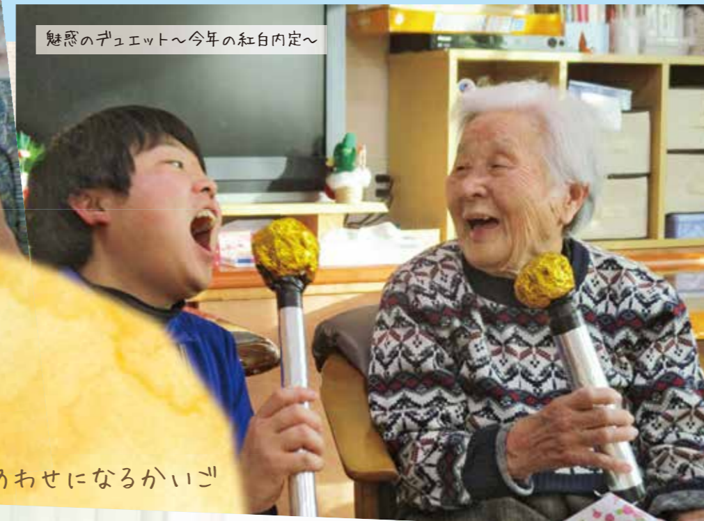
魅惑のデュエット～今年の紅白内定～