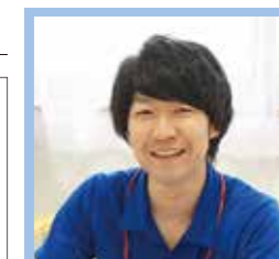
特別養護老人ホームモデラート施設長

資格手当 介護福祉士 ..... ¥17,000 社会福祉士 ..... ¥10,000 社会福祉主事 ..... ¥10,000 認知症ケア専門士 ..... ¥5,000 ケアマネージャー ..... ¥10,000