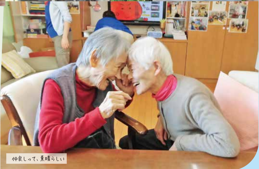
仲良しって、素晴らしい